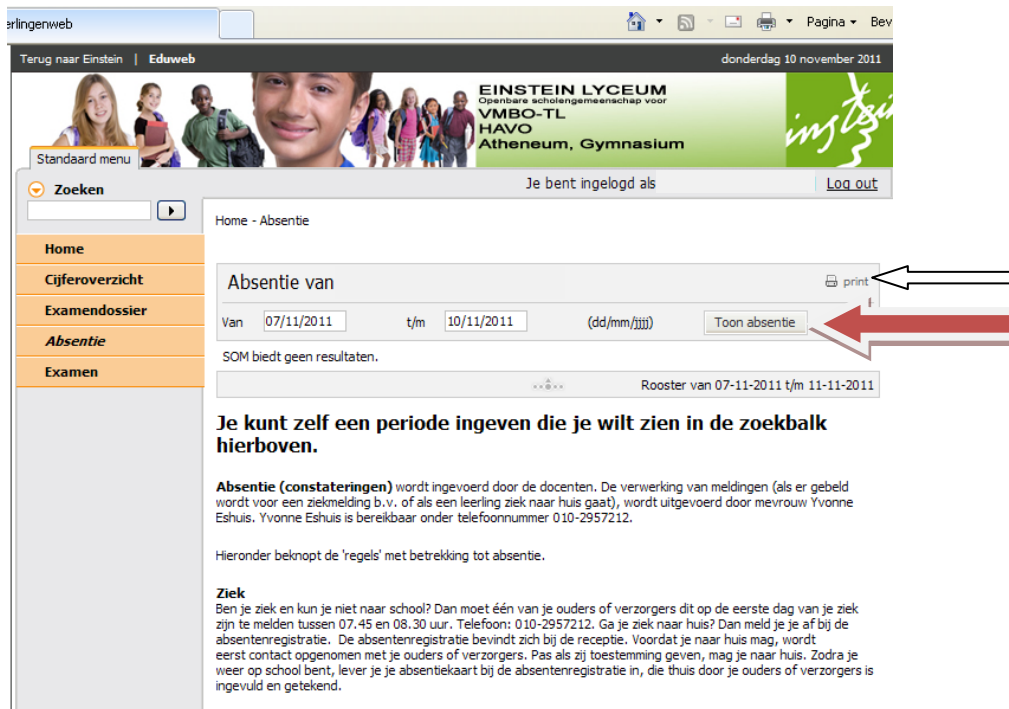
Afbeelding 5, beginscherm absentieoverzicht

Het beginscherm van de absentie geeft de mogelijkheid om een periode te kiezen. Vul dit in en klik dan op de knop "Toon absentie". Ook bij het absentieoverzicht is de printknop aanwezig.